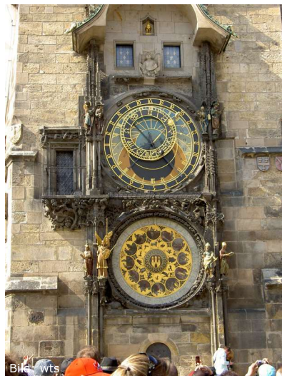
Astronomische Uhr in Prag

Vormittags unternehmen Sie eine Stadtführung durch die Prager Altstadt. Diese wird insbesondere durch die alten Häuser, die zahlreichen Kirchen und romantischen Gassen geprägt. Am Nachmittag besichtigen Sie während einer Führung das Prager Burgviertel und die Prager Burg. Diese bildet das größte geschlossene Burgareal der Welt und liegt auf dem Berg Hradschin. Sehenswert sind vor allem die Loreto-Wallfahrtskirche, der St. Veitsdom, der Vladislavsaal, das Goldene Gässchen und der Burggarten.